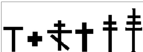
.1. csúcs nélküli tau-kereszt, 2. egyenlő szárú görög kereszt, 3. orosz kereszt, 4. csúcsban végződő, egy vízszintes áthúzással ábrázolt latin kereszt, 5. csúcsban végződő, két vízszintes áthúzással ábrázolt kereszt, 6. csúcsban végződő, három vízszintes áthúzással ábrázolt kereszt.

Szimbólumként a két szára által kijelölt keresztződési pontként jelképezi a világ központját. A vilárendszerező elv alapjaként, négy karja megfelel a négy égtájnak. Az ember jelképeként a függőleges vonal az égi, a szellemi, az intellektuális, a pozitív, az aktív és a hímnemű, míg a vízszintes a földi, a racionális, a passzív és a női aspektust képezi le. Kettős orientáltsága (jobb – bal, fent – lent) miatt tartalmaz pozitív és negatív aspektusokat. Végigkíséri a nagy történelmi kultúrák létét, így Babilonét, Assziriáét, Káldeáét, Egyiptomét,